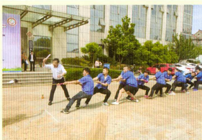
简讯: 4月20日,公司选派12位员工参加马桥街道“展风采,增活力”拔河比赛。经过几轮的奋力拼搏,我公司从35支代表队中脱颖而出,获得了比赛的第七名。(公司工会)